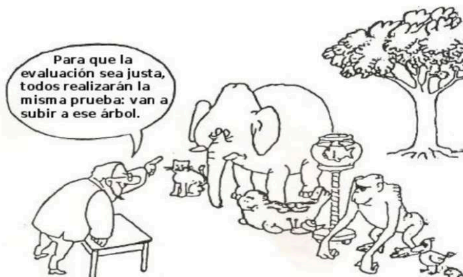
Ilustración cortesía de Miguel Ángel Santos Guerra

Para que la evaluación sea justa, todos realizarán la misma prueba: van a subir a ese árbol.